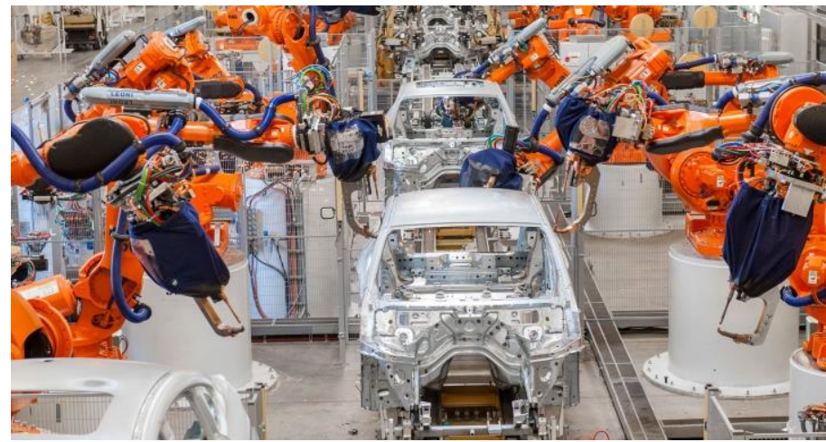
Línia robotitzada de soldadura per punts. Planta de BMW a Spartanburg (Carolina del Sud, EUA)