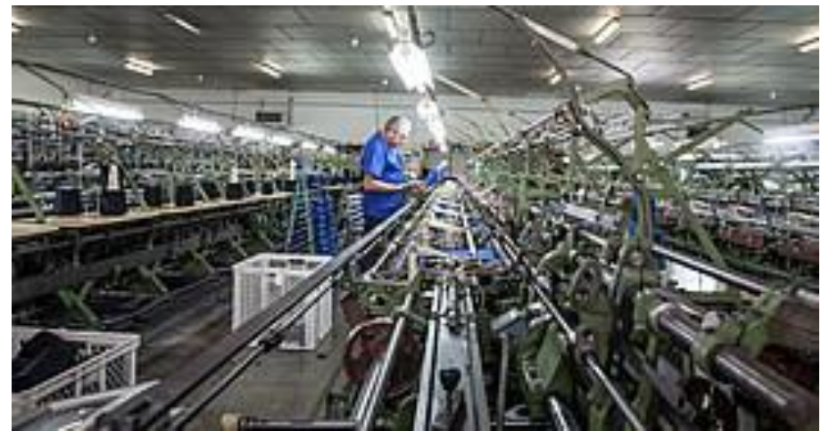
Cooperativa John-fil (Espluga Calba), dedicada a la fabricació de peces de gènere de punt