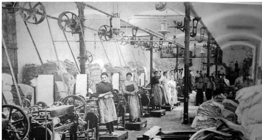
Can Barba (Castellà del Vallès). Telers i embarrats, 1852